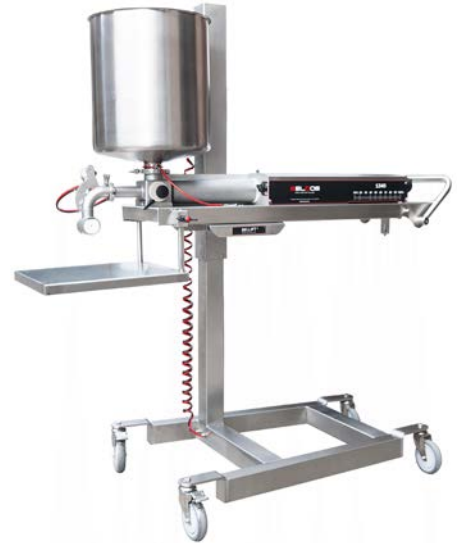
Bellift 1340 Depositor