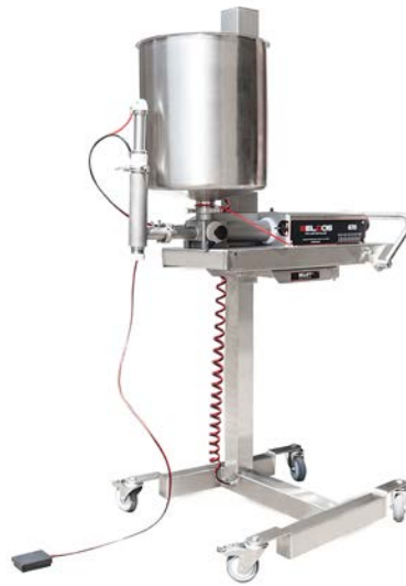
Bellift 670 Depositor