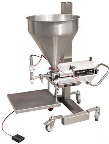
Bellift 275 Depositor