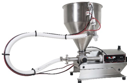
Beltop UNO 275 Depositor