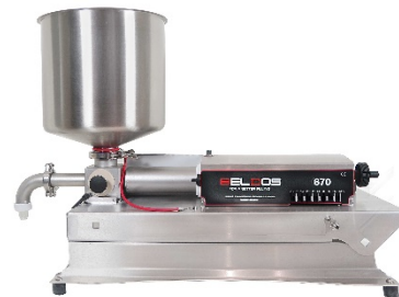
Beltop UNO 670 Depositor