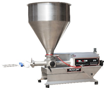
Beltop UNO 275 Depositor