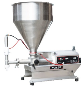
Beltop UNO 275 Depositor