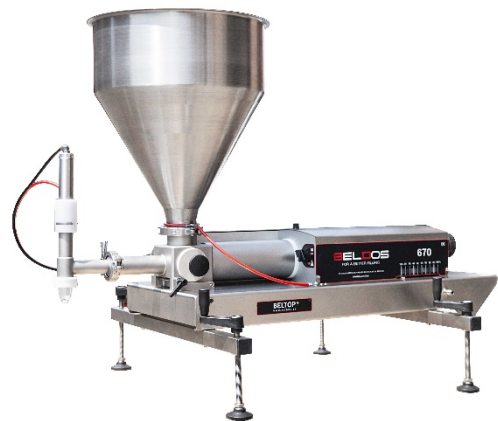
Beltop 670 Depositor