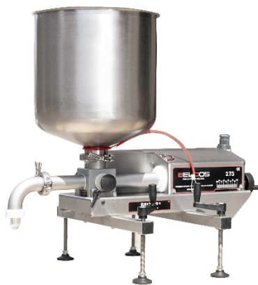
Beltop 275 Depositor